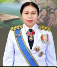
ดร.อรรณญา อินอ่อน ศึกษาธิการจังหวัดกาฬสินธุ์