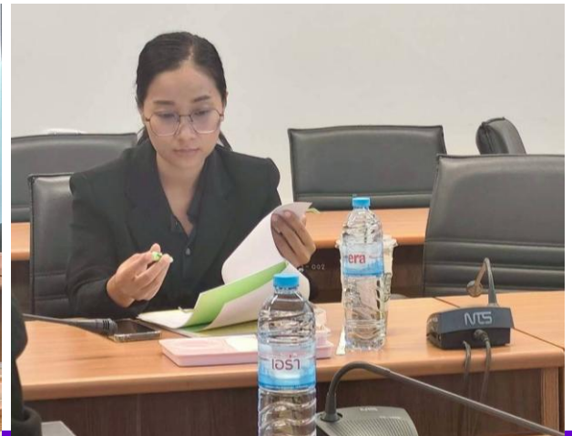
กลุ่มติดตามและประเมินผลการบริหารการศึกษาในภูมิภาค กองส่งเสริมและพัฒนาการบริหารการศึกษาในภูมิภาค สำนักงานปลัดกระทรวงศึกษาธิการ