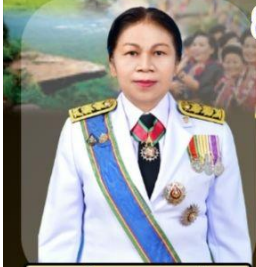
ดร.อรัญญา อินอ่อน ศึกษาธิการจังหวัดกาฬสินธุ์