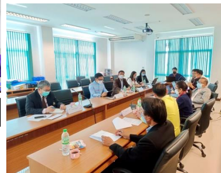
กิจกรรมป่มเพาะนักวิจัย