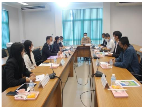
ประชุมวางแผนออกแบบกิจกรรม