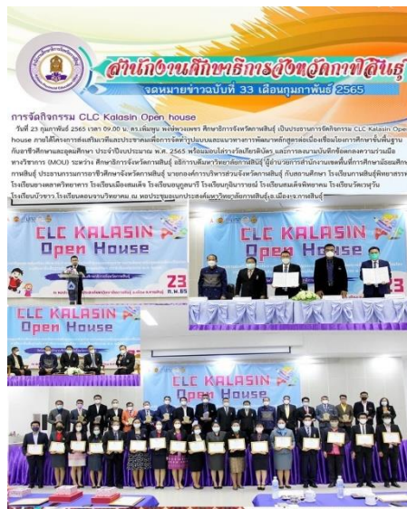
ลงนามความร่วมมือทางวิชาการ MOU