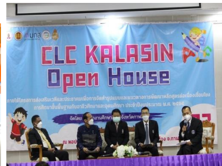
กิจกรรม kalasin open house