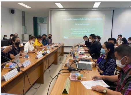
ประชุมผู้ทรงคุณวุฒิ